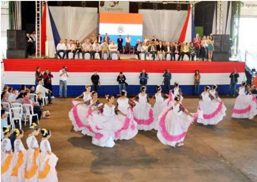
Varios grupos artísticos deleitaron con sus habilidades a quienes participaron de la habilitación oficial de la Expo.

SANTA RITA, Dpto. de Alto Paraná (De nuestra redacción regional). La Expo Santa Rita que arrancó el pasado 3 de mayo, fue inaugurada oficialmente ayer con la presencia de autoridades locales y nacionales, hubo presentaciones artísticas y el tradicional desfile de campeones. El gran ausente fue el presidente de la República, Federico Franco, quien estuvo representado por su vicepresidente, Óscar Denis.