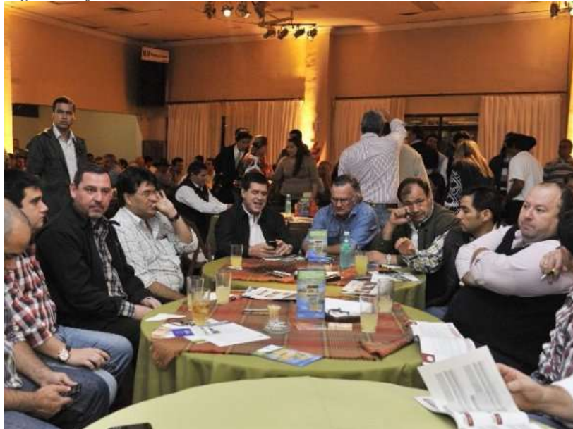
Horacio Cartes (centro) anoche en la ARP.

El presidente electo de la República, Horacio Cartes, se reunió anoche con referentes del sector ganadero del país, del cual forma parte, y les garantizó la realización de un catastro de tierra y seguridad jurídica con los títulos.